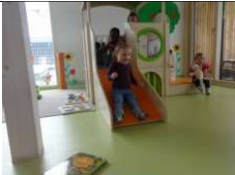
Podest mit Rutschbahn