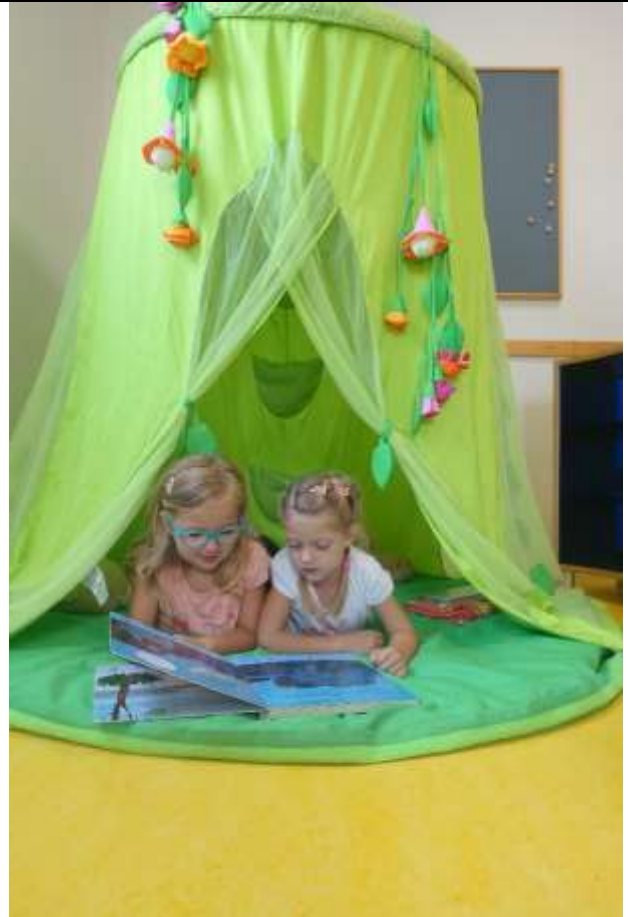
Ruhe-Kuschelzelt / Lesecke